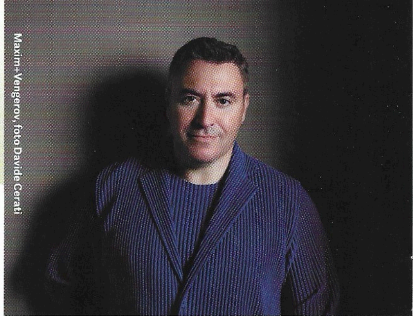
Maxim Vengerov