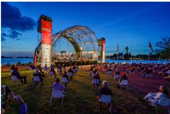
Foto Marco de Swart – voorpagina AD – Rotterdam katern - 14/9/2020