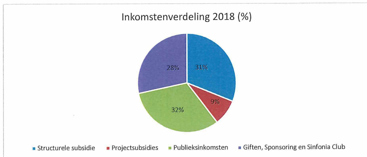
Figuur 1: inkomstenverdeling 2018 (%)

De totale omzet in 2018 bedroeg €705. Structurele subsidie bedroeg daarvan slechts 31%.